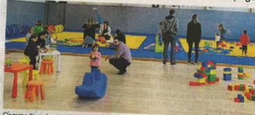
Comme l'année dernière, les familles vont pouvoir s'amuser en famille mercredi et jeudi.

Les petits comme les grands sont invités à venir s'amuser à la halle des sports, mercredi 30 et jeudi 31, de 10 h à 12 h et de 16 h à 19 h. Les animatrices du secteur famille et de la ludothèque de l'Ulamir e Bro Glazik