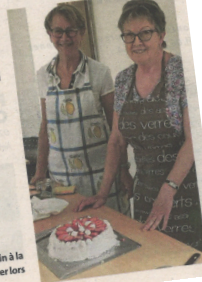
Les pâtisseries ont su mettre la main à la pâte pour réaliser ce superbe fraisier lors du dernier atelier de la saison.

Pratique Tarif : 10 €, plus adhésion. Tel. 02 98 91 14 21.